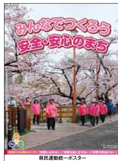
県民運動統一ポスター

暖かな日差しに包まれて、この時を待ちわびていたように木々が芽吹き鳥たちがさえずる季節が訪れました。