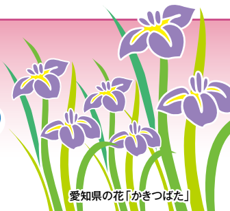
愛知県の花「かきつばた」

発行所：(公社)愛知県防犯協会連合会 名古屋市昭和区円上町26番15号 (愛知県高辻センター 2階) (052) 871-2110